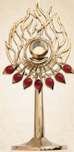
R 02 Relikwiarz św. Jana Pawła II h: 25 cm