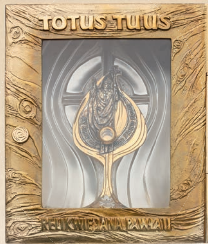
RL 14 Relikwiarium w1: 34 cm, h1: 40 cm, l1: 25 cm w2: 40 cm, h2: 49 cm, l2: 25 cm