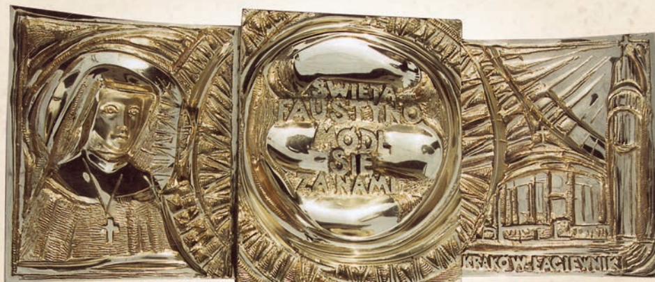
RL 06 Miejsce na relikwie Ø wnętrza ok. 15 cm Ø zewnątrz ok. 30 cm