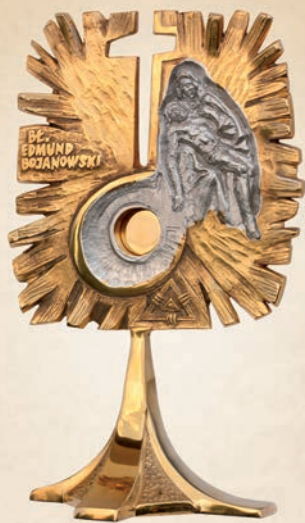
R 09 Relikwiarz bł. E. Bojanowskiego h: 26 cm