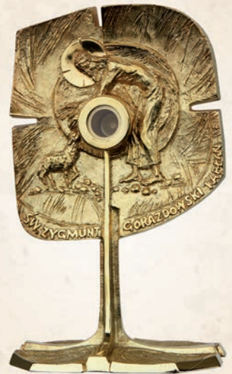
R 06 Relikwiarz św. ks. Gorazdowskiego h: 25 cm