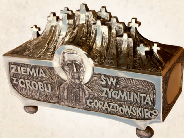
RL 10 Relikwiarium - trumienka z ziemią, z grobu - odlew w: 25 cm, h: 35 cm