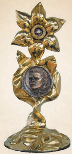
R 03 Relikwiarz bł. Karoliny Kózki h: 30 cm