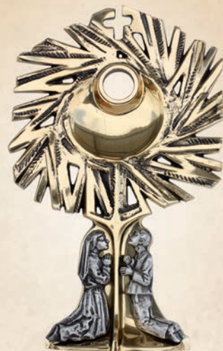
R 10 Relikwiarz Dzieci Fatimskie h: 27,5 cm