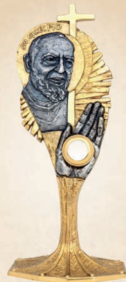
R 18 Relikwiarz św. O. Pio h: 41 cm