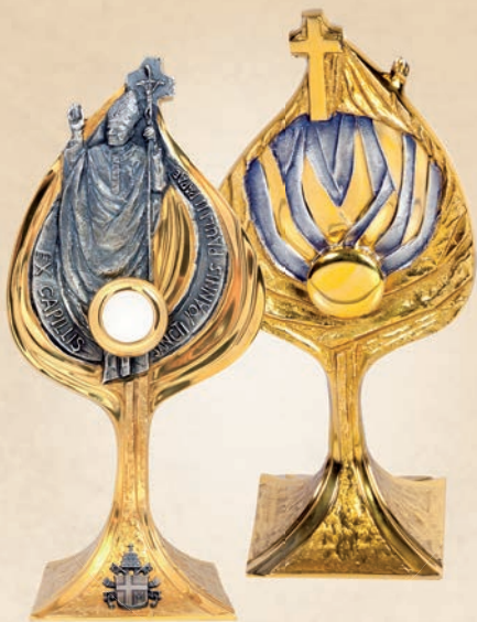
R 08 Relikwiarz św. Jana Pawła II EX CAPILLIS h: 34 cm awers / rewers