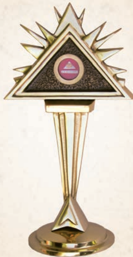
R 05 Relikwiarz współczesny Relikwiarz bł. Edmunda Bojanowskiego. h: 30 cm