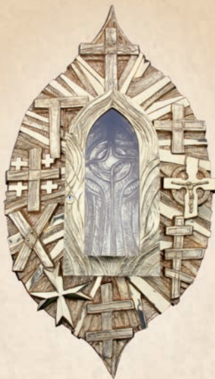
RL 08 Relikwiarium Św. Krzyża Proj. M.Kauczyński w: 50 cm, h: 100 cm, l: 25 cm