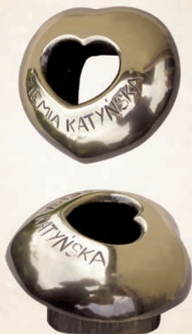
R 11 Relikwiarz Ziemia Katyńska Ø 10 cm