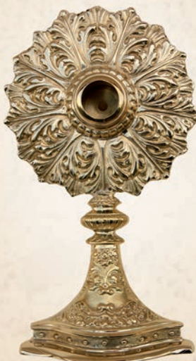
R 07 Relikwiarz klasyczny h: 30 cm