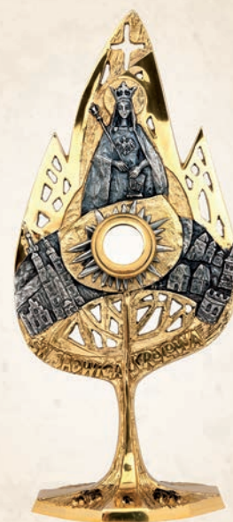
R 22 Relikwiarz św. Jadwiga Królowa h: 40 cm