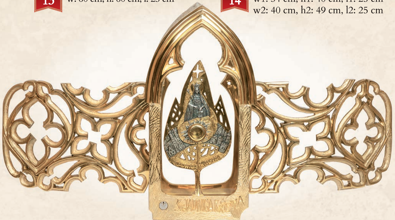
RL 15 Relikwiarium neogotyckie w: 100 cm, h: 60 cm, l: 25 cm