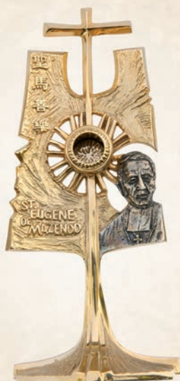
R 12 Relikwiarz św. Eugenia de Mazenoda h: 30 cm