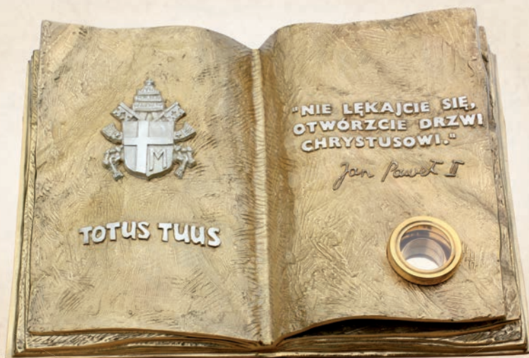
R 13 Relikwiarz „księga” bł. Jana Pawła II h: 35 cm w: 50 cm