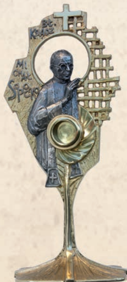
R 24 Relikwiarz bł. ks. Michał Sopoćko h: 35 cm