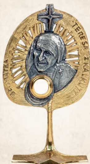
R 20 Relikwiarz bł. Matka Teresa h: 25 cm