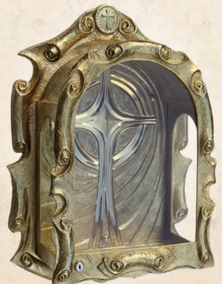
RL 17 Relikwiarium barokowe. w: 40 cm, h: 55 cm, l: 25cm