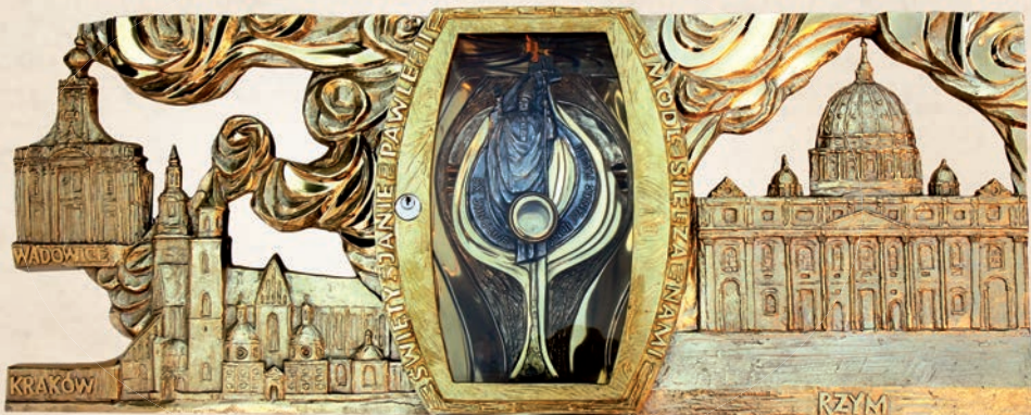
RL 16 Relikwiarium św. Jana Pawła II w: 90 cm, h: 35 cm, l: 25 cm