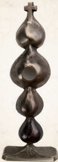
R 04 Relikwiarz św. O. Pio h: 25 cm