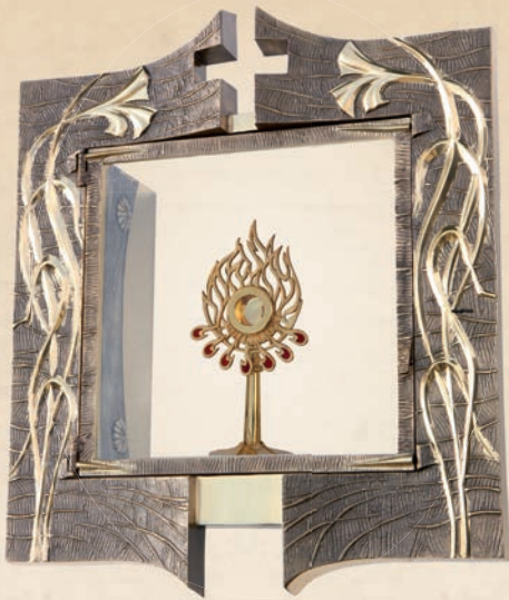
RL 13 Relikwiarium w: 60 cm, h: 60 cm, l: 25 cm