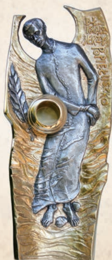
R 23 Relikwiarz bł.ks. Jerzego Popiełuszki h: 33 cm