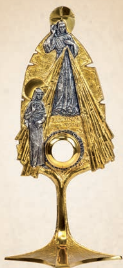
R 16 Relikwiarz św. Faustyny h: 36 cm