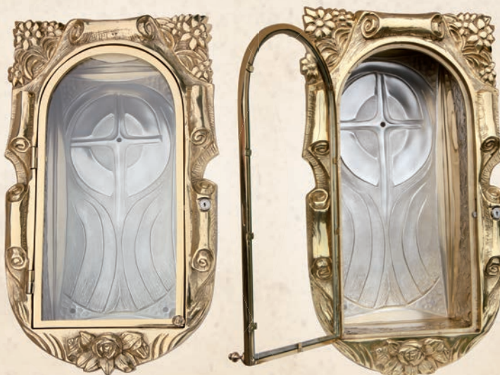
RL 12 Relikwiarium w: 42 cm , h: 66 cm, l: 25 cm