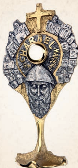
R 21 Relikwiarz św. Charbel h: 35 cm