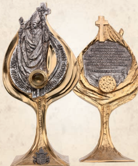
R 08 Relikwiarz św. Jana Pawła II EX SANGUINE h: 34 cm awers / rewers