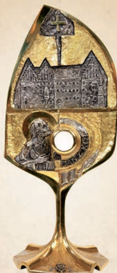
R 17 Relikwiarz św. Jana z Kęt h: 42 cm