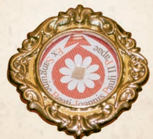
Kapsuła na relikwie max Ø 36 mm