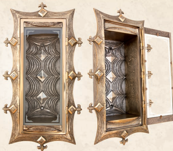
RL 11 Relikwiarium w: 42 cm, h: 78 cm, l: 22