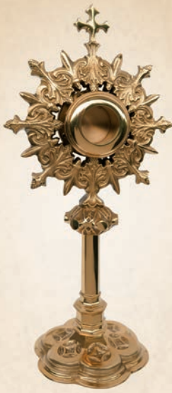
R 01 Relikwiarz w stylu neogotyckim uniwersalny h: 30 cm