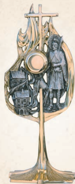
R 14 Relikwiarz św. Florian h: 35 cm