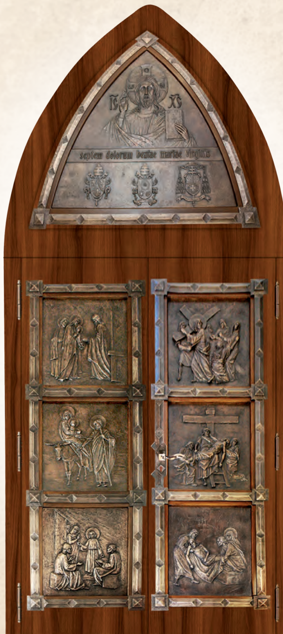
WRN 10 Drzwi kościelne wejściowe – odlewy z brązu