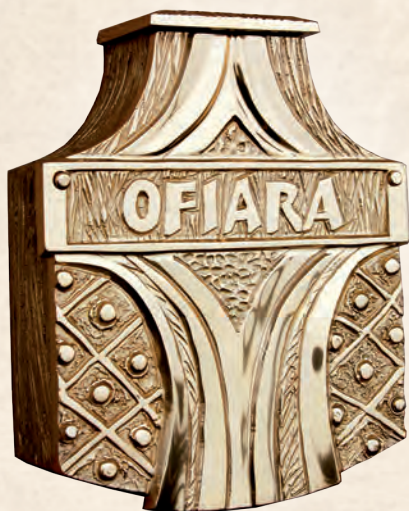
WRN 08 Skarbonka