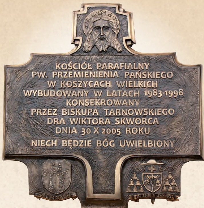
WRN 01 Tablica pamiątkowa