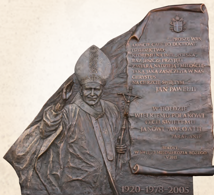
WRN 04 Tablica pamiątkowa