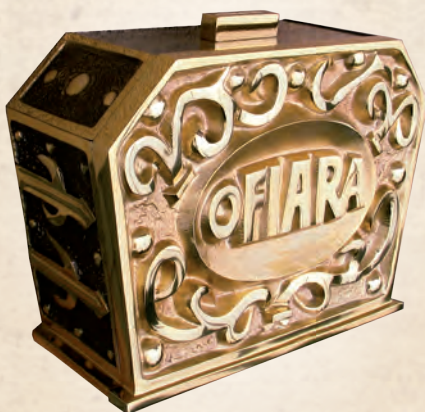
WRN 09 Skarbonka