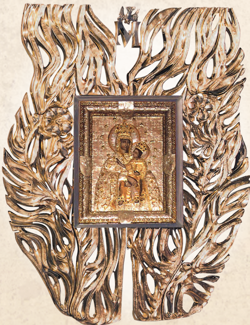
WRN 12 Rama do obrazu