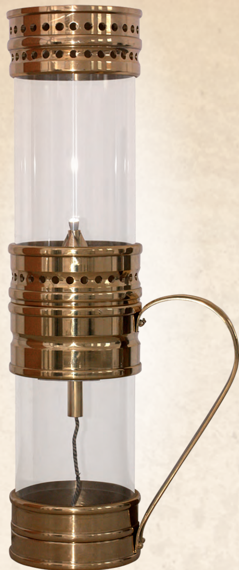
WRN 13 Lampa Łukasiewicza wysokość - 150cm