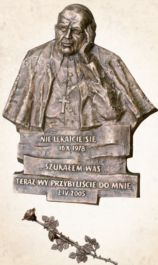
WRN 03 Tablica pamiątkowa