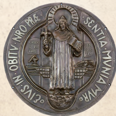
WRN 14 Medalion Dominikański średnica - 30cm