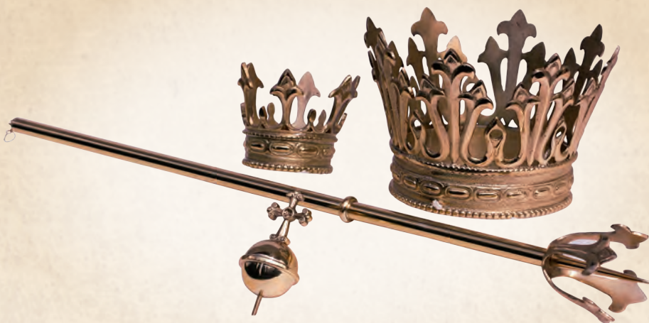
WRN 11 Insygnia na figurę