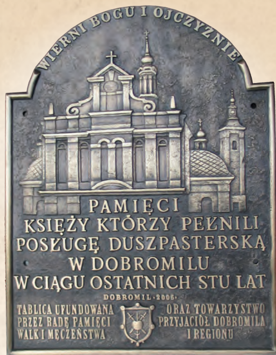
WRN 02 Tablica pamiątkowa